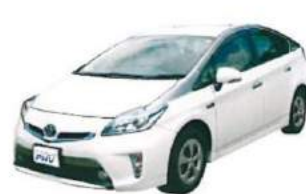
プリウスPHV (コンセント出力 1,500W)

※上記の価格は一例です。切替盤、コントロールBOXは型番により価格が異なります。